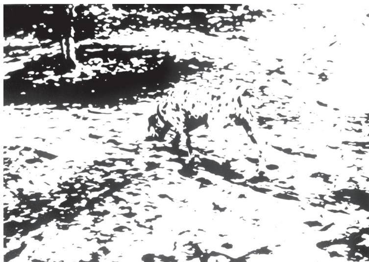
Figura 1.

sistemáticamente no detectemos la información relacionada con nuestras vidas personales y nuestras obligaciones profesionales.