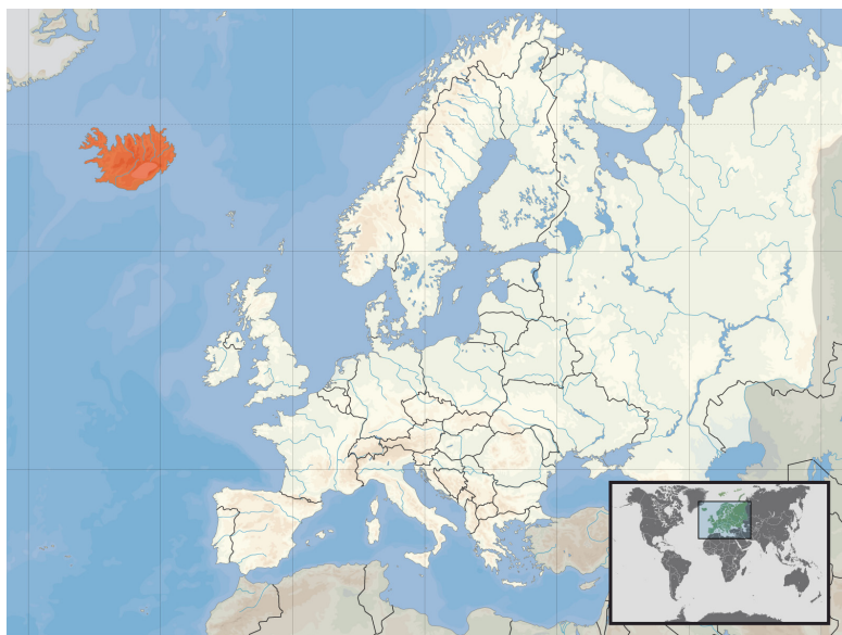
Mapa de la situación de Islandia respecto a Europa.

Resulta de todo punto necesario hacer una brevísima introducción, aun cuando la misma deba ser obligadamente somera y superficial, sobre la historia política, administrativa, económica y social de Islandia hasta finales del siglo xx. Una historia que quizás permita aprehender de forma más fide-