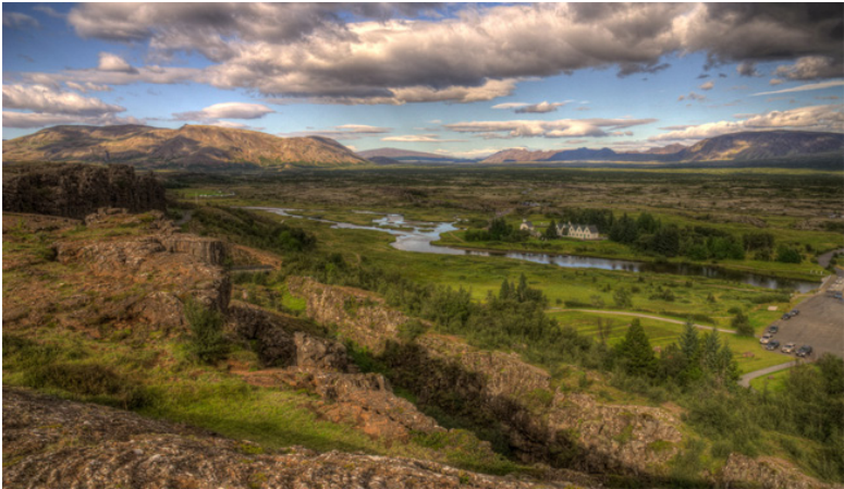
Llanura de Thingvall, origen de las primeras asambleas islandesas.

Desde un punto de vista administrativo, Islandia se compone de ocho regiones, divididas a su vez en condados. Las ocho regiones son: Vestfirðir, Norðurland Vestra, Norðurland Eystra, Austurland, Suðurland, Vesturland, Suðurnes y Höfuoborgarsvæoi. Como se puede apreciar por los nombres, son regiones establecidas en función de criterios en su mayor parte geográficos, en lo que supone una división administrativa de corte marcadamente racionalista.