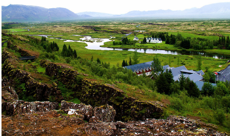
Lugar del Thingvalla donde, según la tradición, se reunía el Alting o Altinghi, la primitiva asamblea de hombres libres islandeses.

A mediados del siglo XIII Islandia pasa a depender políticamente de Noruega, en la figura del rey Haakon IV Haakonsson, aunque aún gozaba de una cierta autonomía y esa sumisión se manifestaba, casi exclusivamente, a efectos tributarios.