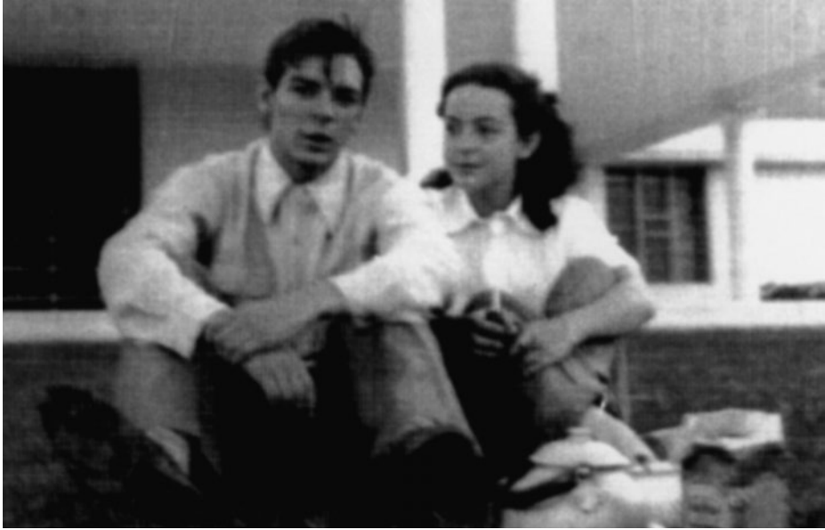
Ernesto con Chichina, su novia de entonces.

Ya en Chile, Alberto y Ernesto se detuvieron en Chuquicamata, desde el 13 hasta el 16 de marzo de 1952. Aquí él ya estaba a pocos meses de convertirse en el Che.