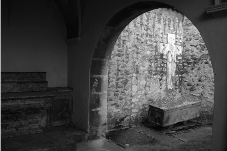
La misteriosa tumba de Arlés-sur-Tech.

cuyas paredes tienen un grosor de 10 cm. Ligeramente inclinado, descansa a unos veinte centímetros del suelo sobre dos zócalos, separado unos diez centímetros del muro de la abadía, y está sellado por una cubierta que se encaja sobre el sepulcro dejando algunos intersticios irregulares de casi un dedo de ancho. Precisamente una de las ranuras laterales permite introducir una pequeña bomba de aspiración a través de la cual se extrae el agua que, supuestamente de manera milagrosa e inexplicable, se genera en la cavidad y a la que se le atribuyen propiedades curativas. En fechas señaladas, el pequeño caudal de agua es dispensado entre los feligreses devotos que peregrinan hasta la iglesia de Arlés.