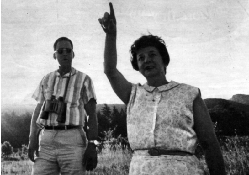
Fotografía de Betty y Barney Hill, los primeros “abducidos” en la historia de la ufología.

tamente “secuestrado” por un OVNI en 1961 y cuyo testimonio solamente es rescatado después de una sesión de hipnosis 19 . A partir de esa fecha los testimonios de personas abducidas se dispararon. ¿Casualidad? Posteriormente, clásicos de la literatura ufológica como Missing Time de Bud Hopkins (1980) continuarían inflando el mito de las abducciones sin cuestionarse si estas se debían a hechos físicamente reales... o a la sugestión desencadenada durante el trance hipnótico.