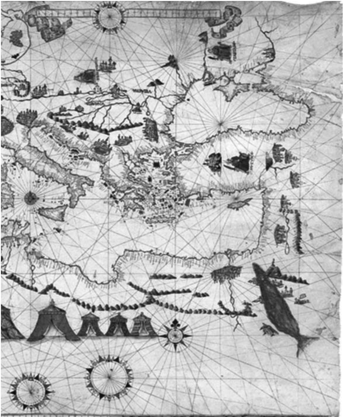
Los portulanos eran cartas náuticas donde se especificaban los puertos de cada costa y alguna información más. Portulano de 1541 de Maggiolo.