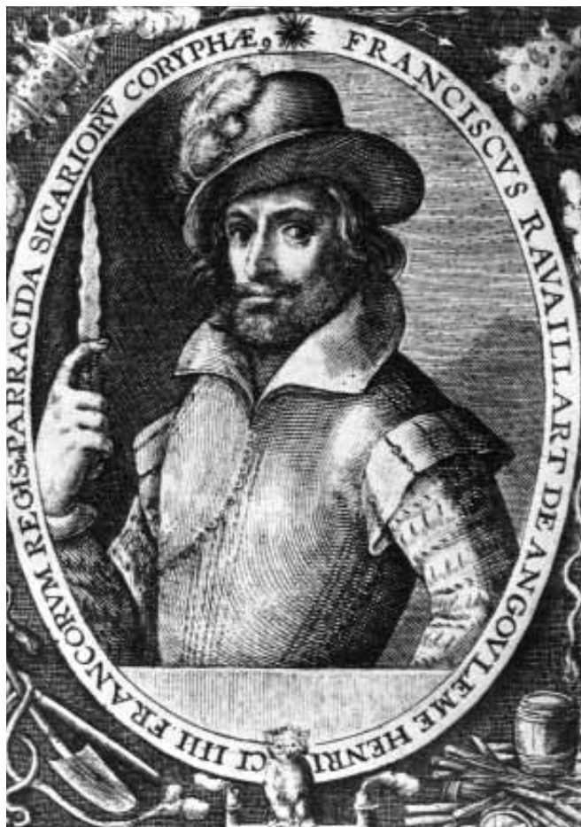
François Ravallac, asesino de Enrique IV de Borbón. Ravallac era un oscuro personaje, convencido de que Dios le había encomendado acabar con el protector de los hugonotes.