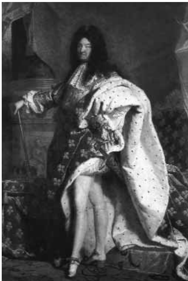
Este retrato del Rey Sol, obra de Hyacinthe Rigaud (1701), ha pasado a la iconografía popular como la más fiel representación del absolutismo borbónico.