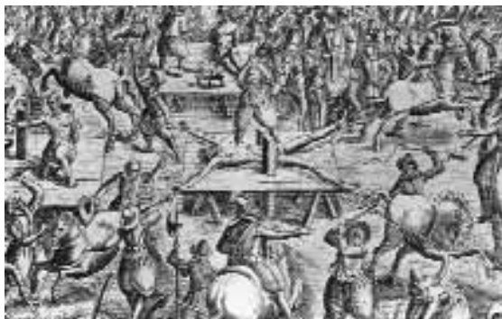
Suplicio de Ravailiac en la plaza de Grève de París. Fue una ejecución de Estado, cuyo carácter ejemplarizante se planificó hasta sus últimos detalles.

loso y suspicaz que inmortalizara, ya en el siglo XIX, Alejandro Dumas en su saga de mosqueteros tuvo, eso sí, la buena estrella de poder rodear se de personajes verdaderamente extraordinarios, maestros en el arte de gobernar, cuyo principal exponente fue el cardenal Richelieu, padre, en muchos sentidos, de lo que se dio en llamar «la razón de Estado» como credo antepuesto a cualquier otro, léase confesión religiosa, pacto, tratado o alianza. Richelieu implantó en Francia un modo de gobernar novedoso y moderno, que pasaba por la centralización administrativa y la sujeción de los señores feudales, dibujando de este modo los umbrales de lo que muy pronto se iba a convertir en el absolutismo del Rey Sol. Absolutismo más pretendido que real, aunque si algún reinado europeo puede calificarse como tal, ese fue sin duda el de Luis XIV (1643-1715), abuelo y principal mentor de Felipe V, el primer Borbón español. Un abuelo, por cierto, de armas tomar, más que capaz de recibir, según cuentan las crónicas, a embajadores y plenipotenciarios extranjeros bien asentado en su silla-retrete de Versalles. Él al menos tenía