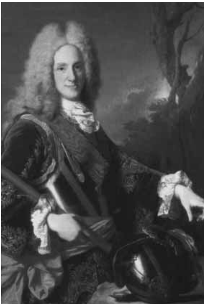
El célebre retrato de Felipe V pintado por Jean Ranc en 1723. A pesar de la imagen de majestad y dominio, el rey, aquejado de melancolía, ya había previsto su abdicación en la persona de su hijo Luis I.