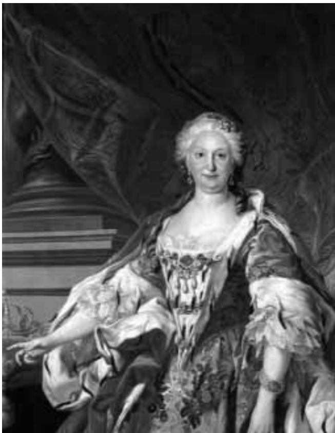
Isabel de Farnesio, la Brava Donna , segunda esposa de Felipe V. Retrato de Louis Michel Van Loo, 1739. Museo del Prado. Tenida en la corte española por una candidata al trono útil para las relaciones internacionales e inofensiva para la política de Estado, demostró nada más pisar España que era una mujer de gran determinación y espíritu indomeñable. La poderosa princesa de los Ursinos fue la primera en sufrir en sus propias carnes la ira de la princesa de Parma.