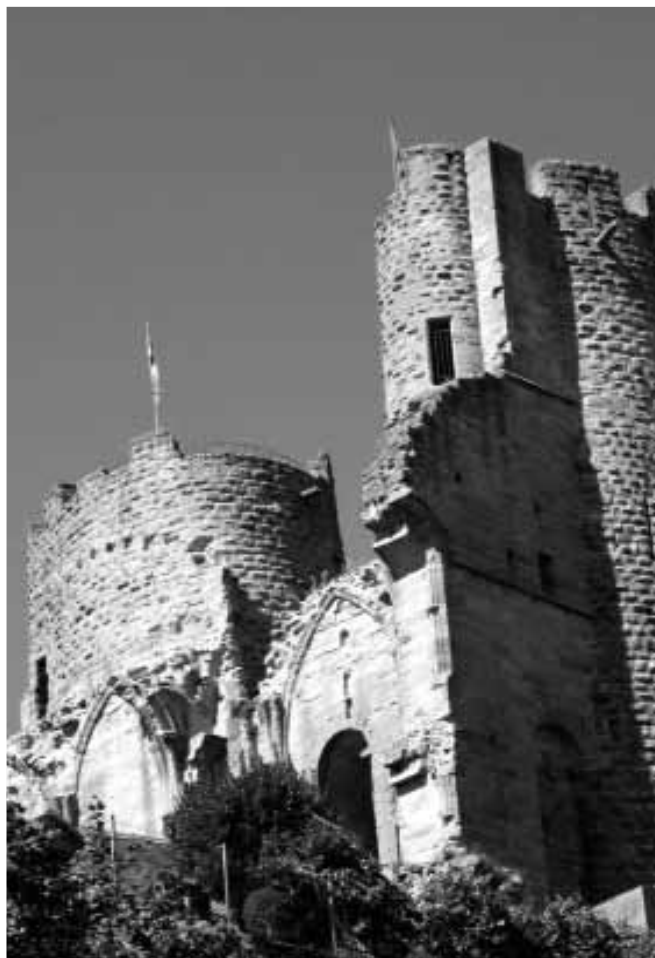
Vista del castillo-matriz de los Borbones en Moulins, hoy una ilustre ruina en su mayor parte.