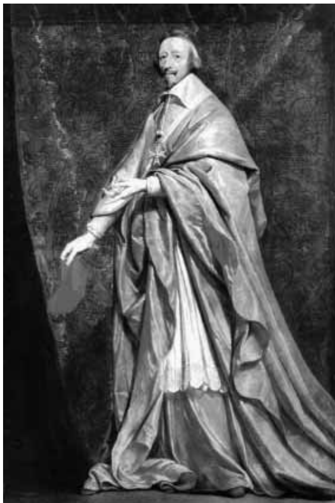
El sagaz cardenal Richelieu, artífice del Estado moderno francés, retratado por su pintor de cámara Philippe de Champaigne.