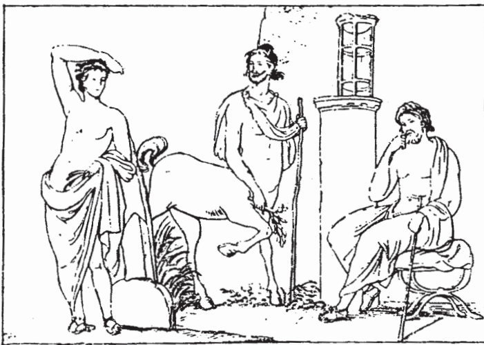
Los tres dioses de la curación: Apolo, Quirón y Asklepios (mural de Pompeya)

A Quirón le fueron encomendados muchos héroes para que los adiestrara en la caza, la música (enseñaba con un instrumento llamado kithara , que es el precursor de la guitarra moderna), en el arte militar además de la medicina. Entre otros, cabe destacar a Acteón, Eneas, Jasón y Medeo.