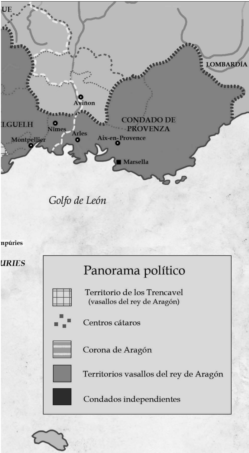
Corona de Aragón y Languedoc a principios del siglo XIII.