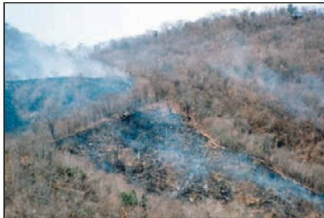
Agricultura del tipo tumba-roza-quema. Este tipo de sistema agrícola fue empleado en toda la zona maya, como su nombre lo dice consiste en talar la selva, dejar que la vegetación cortada se seque para después quemarla y así agregarle nutrientes al suelo pobre de la selva.

Los números de esta cuenta continua eran representados mediante puntos con valor de uno y barras con valor de cinco. Mediante la combinación de estos signos podían representar cualquier número. El empleo de este calendario y su conocimiento matemático, unidos a su amplio conocimiento astronómico y la pericia en la observación de los astros, permitieron a los mayas calcular con gran exactitud la duración del año solar, fijándola en 365.2422 días. También consiguieron computar los periodos lunares y el ciclo de Venus, así como los ciclos de otros astros y constelaciones.