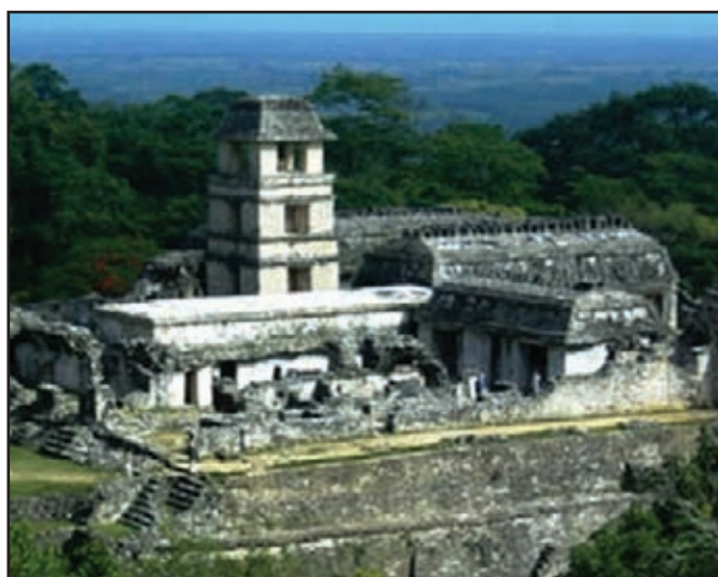
El Palacio. Palenque, Chiapas.

Las urbes mayas buscaron concentrar diversos productos básicos como cacao, pluma, sal, pieles de animales, piedras preciosas, etc. y dominar las rutas comerciales que seguramente les reportaban ingresos por peaje o simplemente les beneficiaban por estrategia geográfica. Esto provocó que las guerras entre los mayas fueran algo cotidiano que podía llevar al vasallaje o incluso a la desaparición total de cierta ciudad. Como sucede actualmente, la guerra fue para los mayas un puntal de su economía.