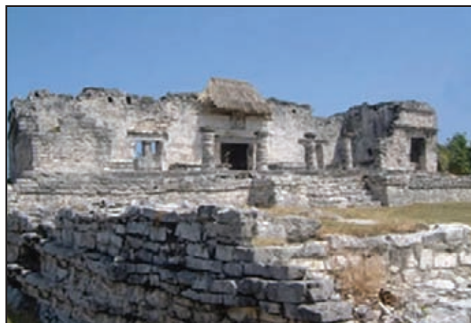
Tulum. Quintana Roo.

El ahucán o gran sacerdote también era un puesto hereditario y solo unas cuantas familias