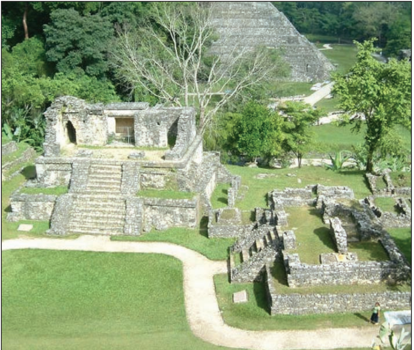
Templo del Sol. Palenque, Chiapas.

Los mercaderes profesionales tenían un alto rango en la jerarquía social. Eran miembros de la nobleza, no sólo por descender de los navegantes putunes conquistadores de esa tierra, sino por tener en sus manos esa importante actividad económica que era el comercio. Después le seguían los guerreros y administradores.