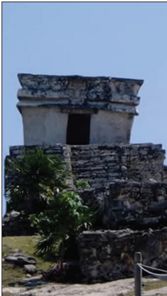
Tulum, Quintana Roo.

la ciudad en que vivía y tenía a su mando a los jefes locales de otras poblaciones. Tenía derecho a pedir tributo y participaba en las decisiones políticas con ayuda de un consejo constituido por jefes, sacerdotes y consejeros miembros de la nobleza.