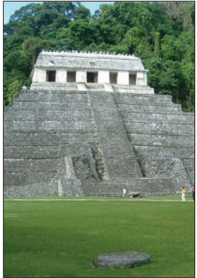
Templo de las Inscripciones. Palenque, Chiapas.

La elite social la constituían los sacerdotes y los nobles. Ellos residían en la ciudad y centro religioso. Los campesinos vivían en las zonas rurales cercanas a la ciudad. La sociedad maya estaba organizada sobre la base de una marcada estratificación social.