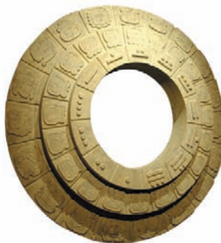
Los mayas desarrollaron uno de los calendarios más precisos de la historia. Gracias al conocimiento de este calendario podemos saber exactamente cuando sucedieron los hechos narrados en las estelas.